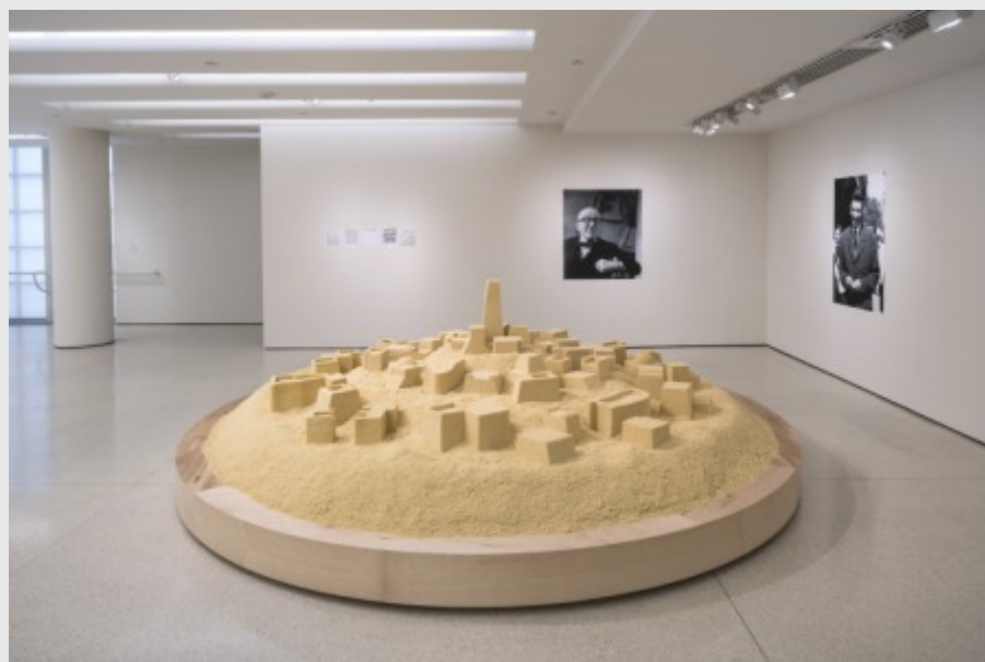
KADER ATTIA - Senza titolo (Ghardaïa), 2009 Couscous, due stampe a getto d'inchiostro e cinque stampe fotocopie, Edizione 2/3 Solomon R. Guggenheim Museum, New York

Tredici artisti danno voce, attraverso lavori su carta , installazioni , fotografia , scultura e video , alle loro terre di origine e al rapporto tra passato e presente che le caratterizza, perché la storia non si ferma ai confini: i popoli, le culture, la bellezza e memorie si muovono, si spostano, si contaminano e si influenzano , come raccontano le cronache degli ultimi anni.